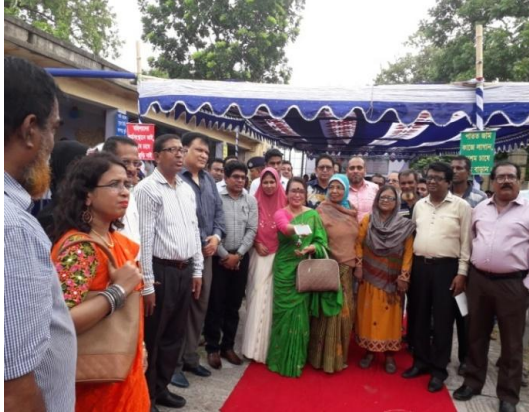
রাজশাহীতে রেশম উৎসবে ভারতীয় বিশেষজ্ঞ দলসহ অতিথিবৃন্দ