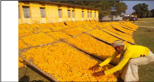
বাস্পার ফলনে হাস্যোজ্জ্বল রেশম চাষি