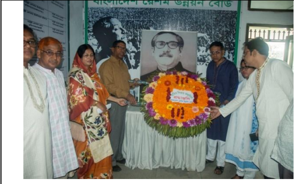
জাতির পিতা বঙ্গবন্ধু শেখ মুজিবুর রহমানের জন্মবার্ষিকীতে শ্রদ্ধাঞ্জলি