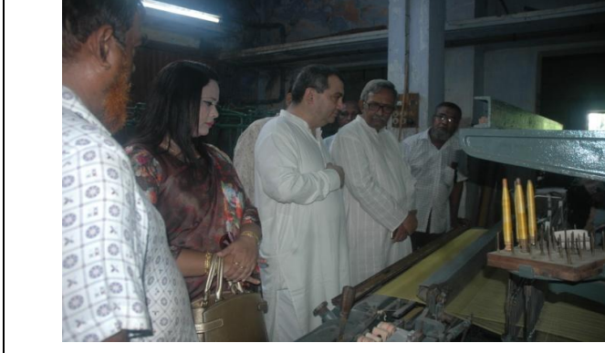
রাজশাহী রেশম কারখানা পরিদর্শন করছেন বস্ত্র ও পাট মন্ত্রণালয় সম্পর্কিত সংসদীয় স্থায়ী কমিটির মাননীয় সভাপতি জনাব সাবের হোসেন চৌধুরী ও রাজশাহী-২ আসনের মাননীয় সংসদ সদস্য জনাব ফজলে হোসেন বাদশা