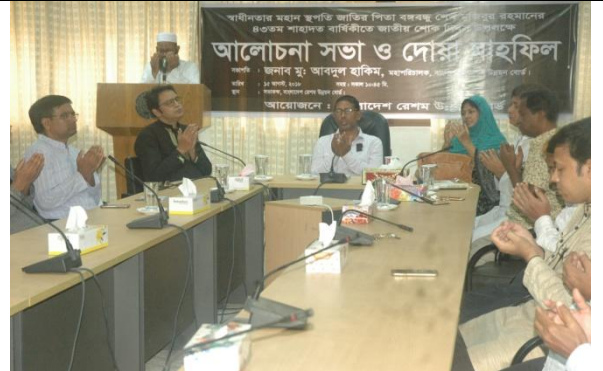
জাতির পিতা বঙ্গবন্ধু শেখ মুজিবুর রহমানের শাহাদত বার্ষিকীতে আলোচনা সভা ও দোয়া মাহফিল