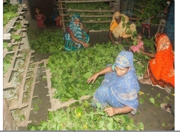
পলুপোকা পরিচর্যায় ব্যস্ত মহিলা রেশম চাষিগণ