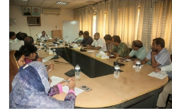
বোর্ডের সভাকক্ষে কর্মকর্তা/কর্মচারীদের ইন-হাউজ প্রশিক্ষণ