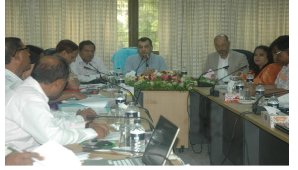
বস্ত্র ও পাট মন্ত্রণালয় সম্পর্কিত সংসদীয় স্থায়ী কমিটির মাননীয় সভাপতি জনাব সাবের হোসেন চৌধুরী এর সভাপতিত্বে ও মাননীয় প্রতিমন্ত্রী জনাব মির্জা আজম এর উপস্থিতিতে রেশম উন্নয়ন বোর্ডের সভাকক্ষে অনুষ্ঠিত উক্ত কমিটির সভার চিত্র