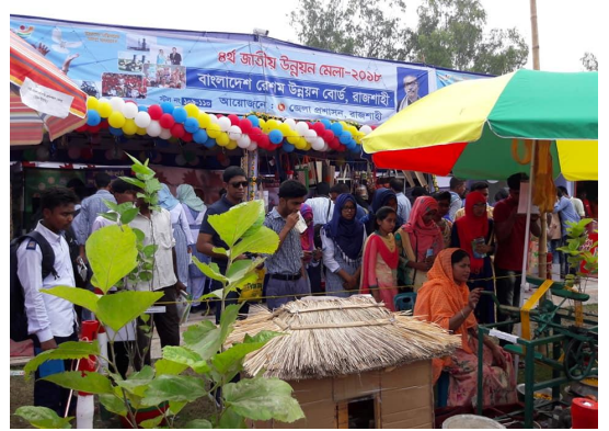
৪র্থ জাতীয় উন্নয়ন মেলায় রেশম উন্নয়ন বোর্ডের স্টল পরিদর্শন করছেন দর্শনার্থীগণ